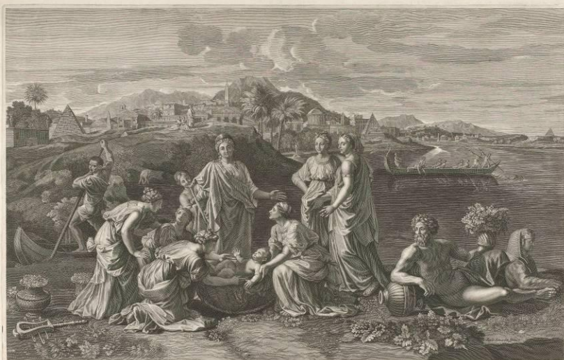
Moïse tiré des eaux du Nil par la fille de Pharaon.

Représentation de la découverte du jeune Moïse par la fille du Pharaon, d'après le tableau de Michel-Ange.