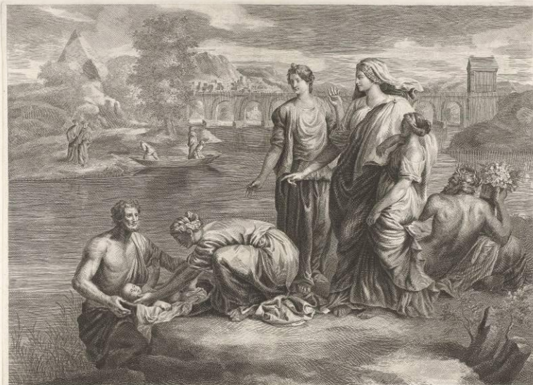
Accipe ait, puerum istum et nutri mihi: ego dabo tibi mercedem tuam.

Représentation de la découverte du jeune Moïse par la fille du Pharaon, d'après le tableau de Michel-Ange.