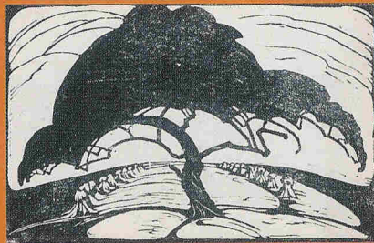
Klaas van Leeuwen, Boom en akkers , houtsnede