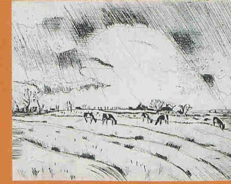
Jan Wiegers, Koeien in een landschap , droge naald