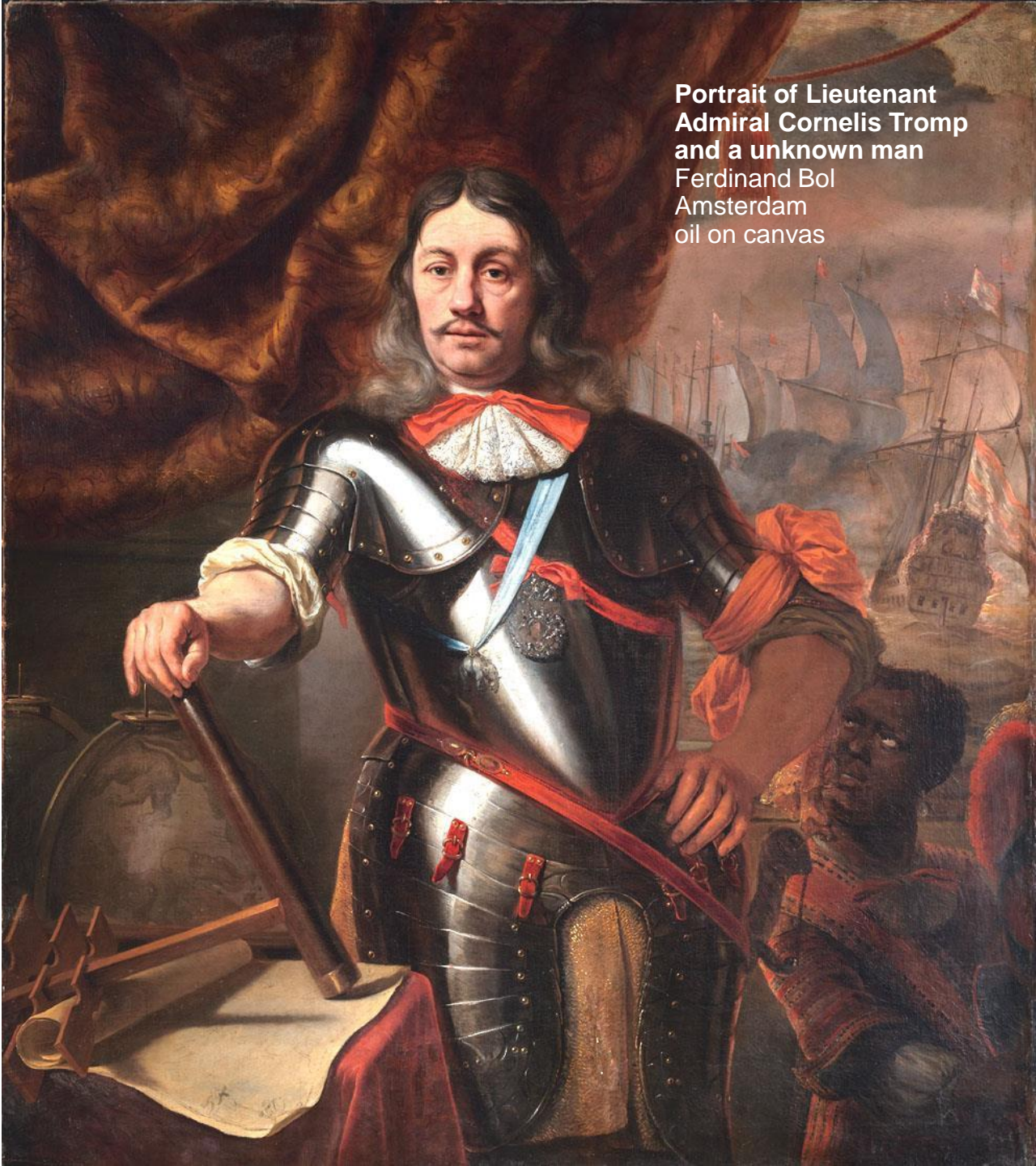
Portrait of Lieutenant Admiral Cornelis Tromp and a unknown man Ferdinand Bol Amsterdam oil on canvas