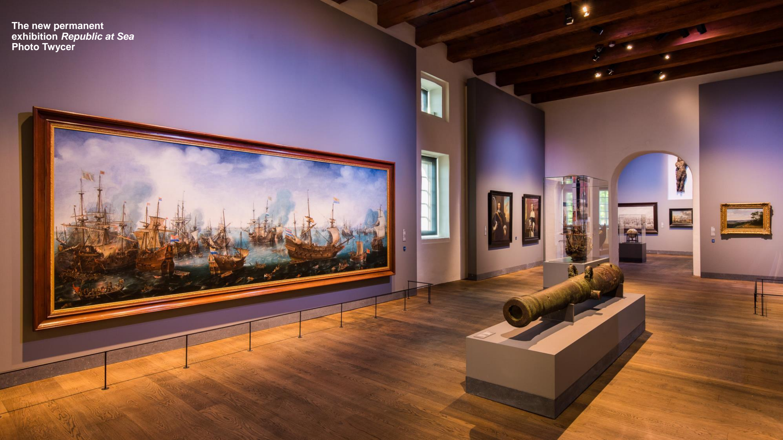
The new permanent exhibition Republic at Sea