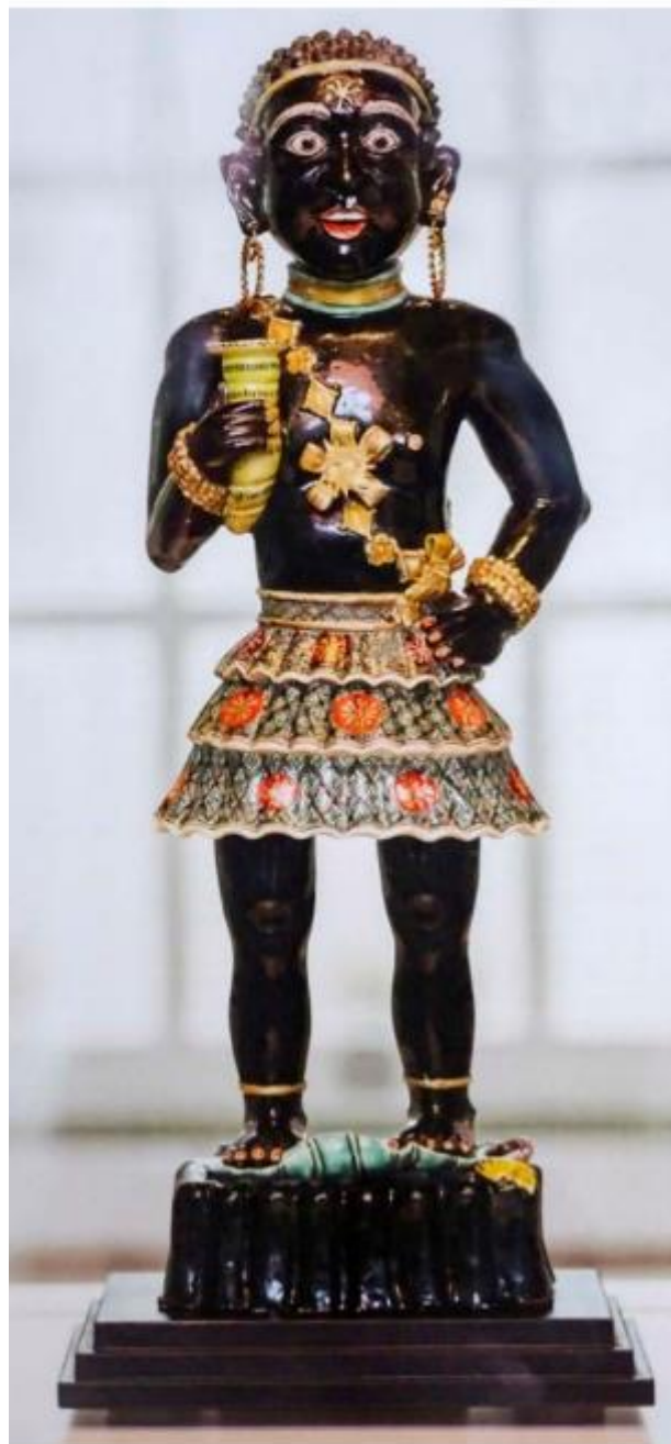
Voor enkele tonnen aangekocht door Scheepvaartmuseum: een blackamoor, een Chinees porselein beeldje van een zwarte Afrikaan

In 2013 organiseerde hetzelfde museum de tentoonstelling De zwarte bladzijde , die op indringende wijze de grootste misdaad uit de Nederlandse slavenhandelsgeschiedenis liet zien. Begin januari 1738 raakte het slaverschip Leusden lek in de Marowijbe rivier in Suriname en sloot de bemanning de slaven op in het ruim. Tijdens